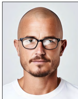
Augen nicht klar erkennbar