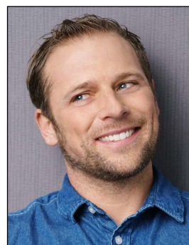
offener Mund, Kopf geneigt