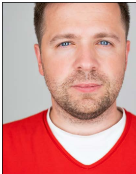
Kopf nicht vollständig