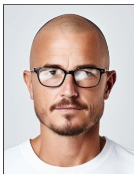
Augen nicht klar erkennbar