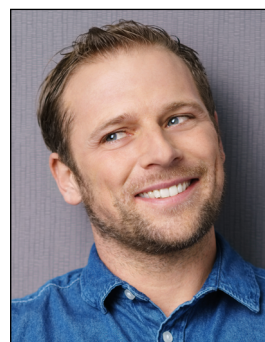
offener Mund, Kopf geneigt