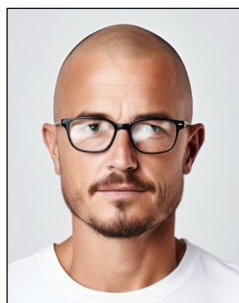
Augen nicht klar erkennbar