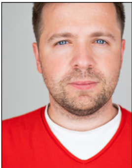
Kopf nicht vollständig