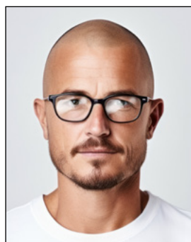
Augen nicht klar erkennbar